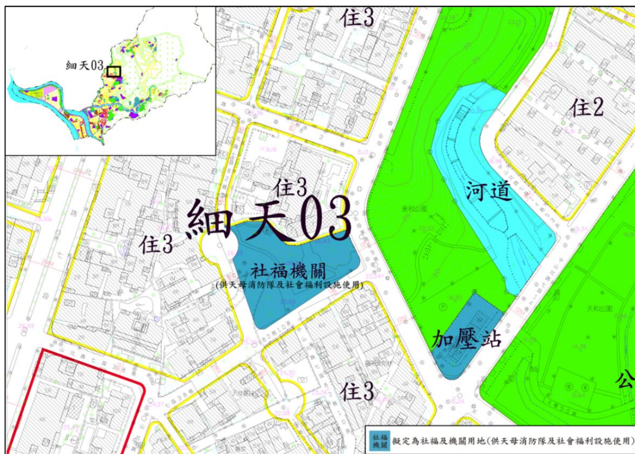
圖1 細天 03 擬定計畫示意圖