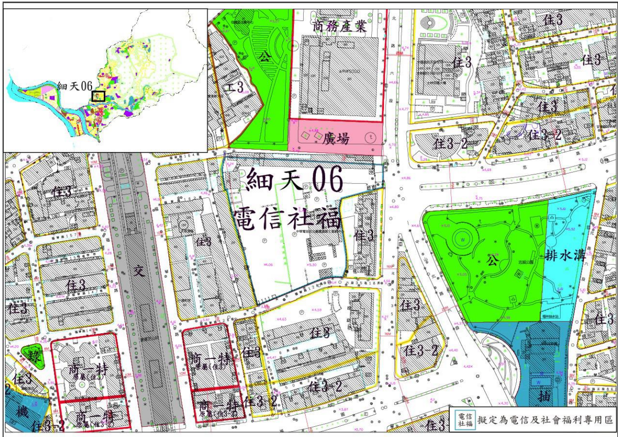
圖2 細天 06 擬定計畫示意圖