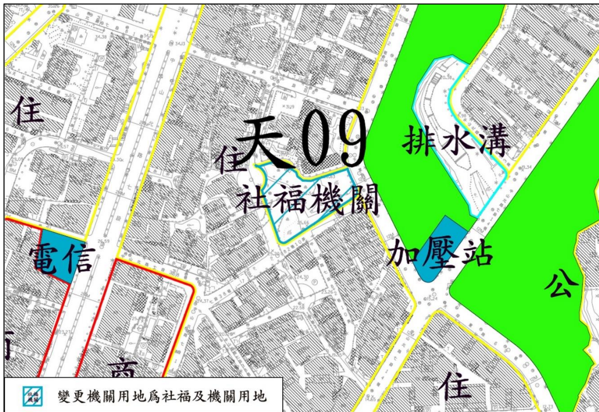
圖 2 天母生活圈天 09 變更示意圖 ※本圖示為示意圖，仍以都市計畫圖為準