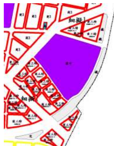
圖 4 細部計畫-中萬華生活圈擬定細部計畫內容位置示意圖

註：本案公開展覽之都市計畫書圖資料可至「臺北市政府都市發展局網站/公展公告/都市計畫公展」下載。(網址 http://www.udd.taipei.gov.tw/ )