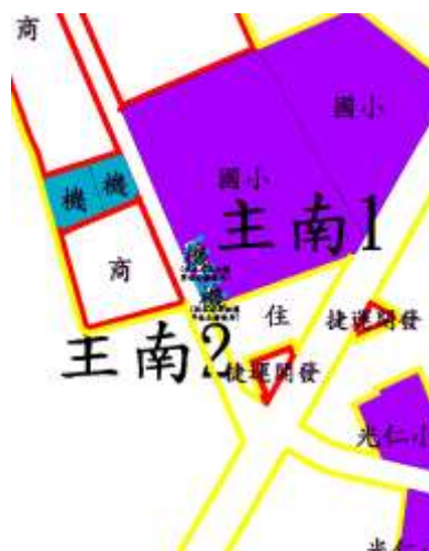
圖 3 主要計畫-南萬華生活圈主要計畫變更內容位置示意圖