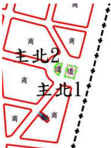
圖 2 主要計畫-北萬華生活圈主要計畫變更內容位置示意圖