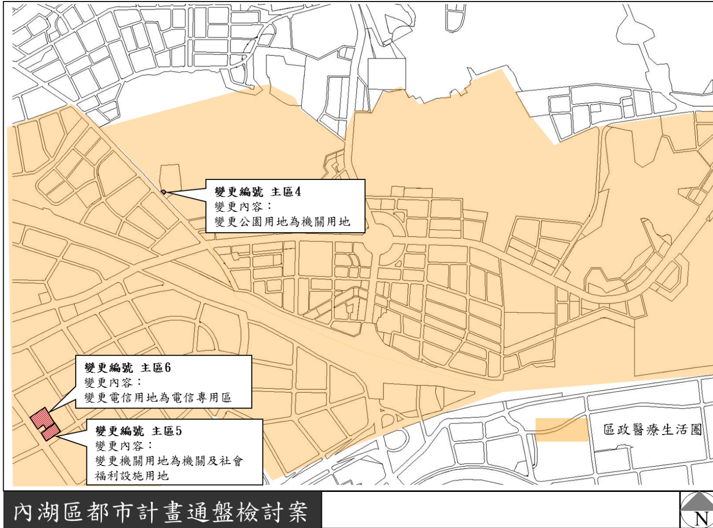
圖 2-1 區政醫療生活圈變更位置示意圖(第 2 次公告公開展覽版)