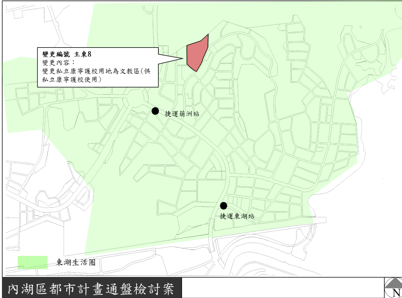
圖 2-3 東湖生活圈變更位置示意圖(第 2 次公告公開展覽版)