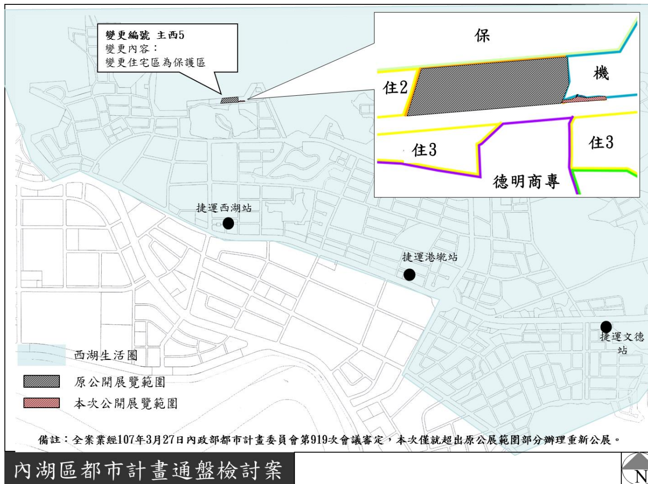
圖 2-2 西湖生活圈變更位置示意圖(第 2 次公告公開展覽版)