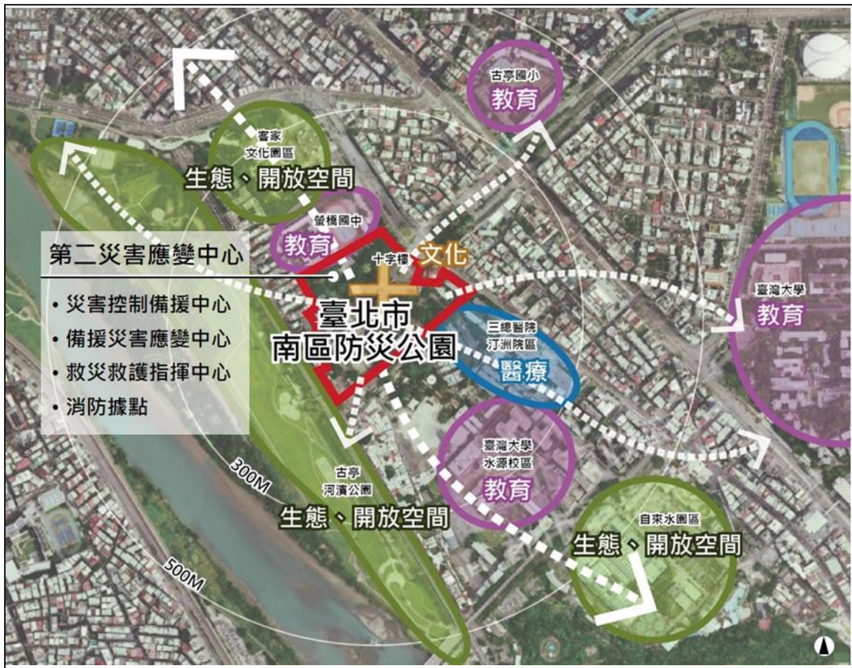
圖 4 防災備援可及空間支援功能示意圖