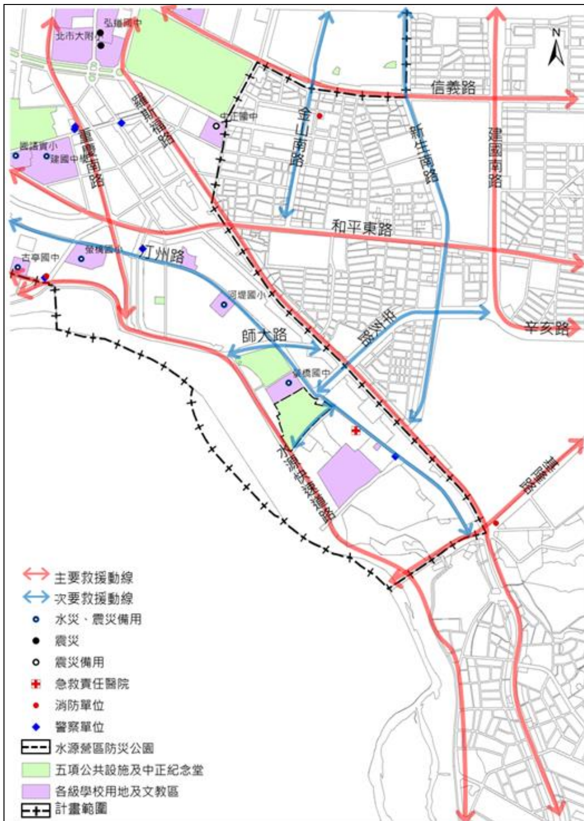
圖 6 水源營區防災公園救援動線分布示意圖