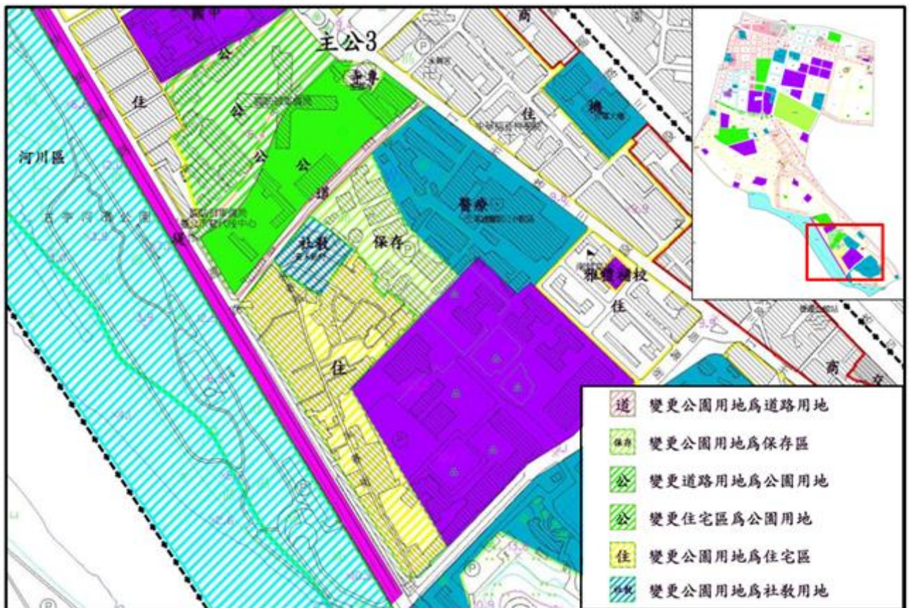
圖 8 公館生活圈變更示意圖(主公 3)