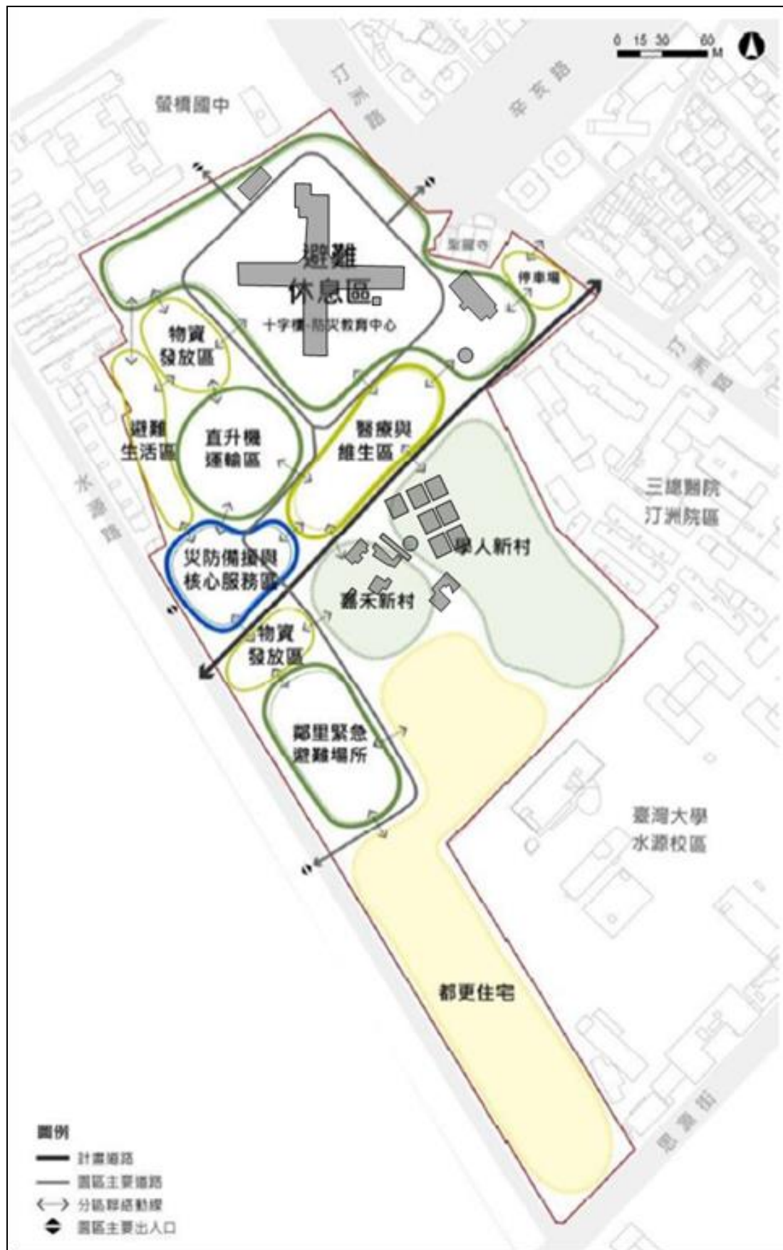
圖 5 防災需求構想圖