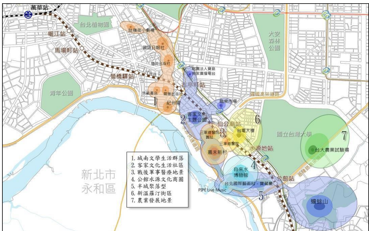
圖 1 園區與周邊重要文化、生態關係示意圖

延續防災公園南側寶藏巖以及自來水博物館園區，並承接北側之客家文化主題公園與城南文學生活群落，完備臺北市南區水岸綠帶，並結合周邊學校資源，可有效提升區域生活環境品質並帶動周邊發展，疏通連結文化與保育之休閒遊憩廊道（詳圖 1）。