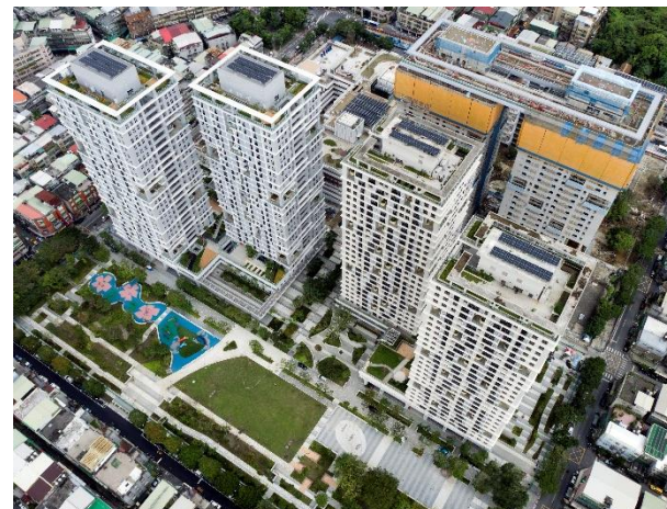
案例：臺北市信義區行政中心、廣慈衛福大樓及社會住宅規劃