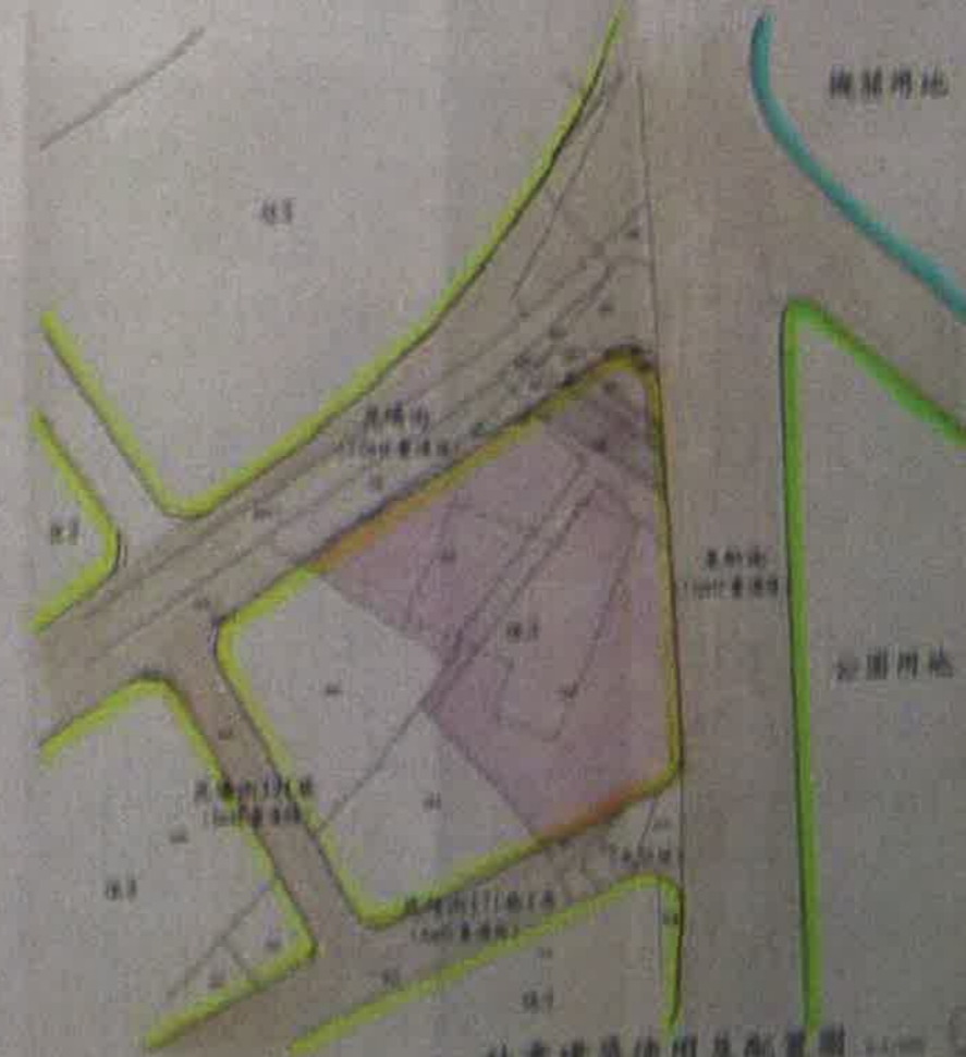
計畫建築使用及配置圖 1:1000