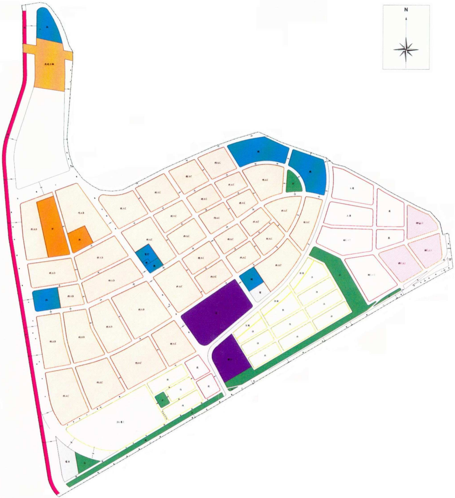
臺北市政府公告「臺北市內湖區舊宗段、潭美段五小段」已開闢完竣之都市計畫道路境界線為建築線範圍示意圖